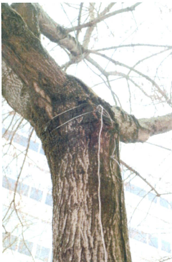
Av João Crisóstomo