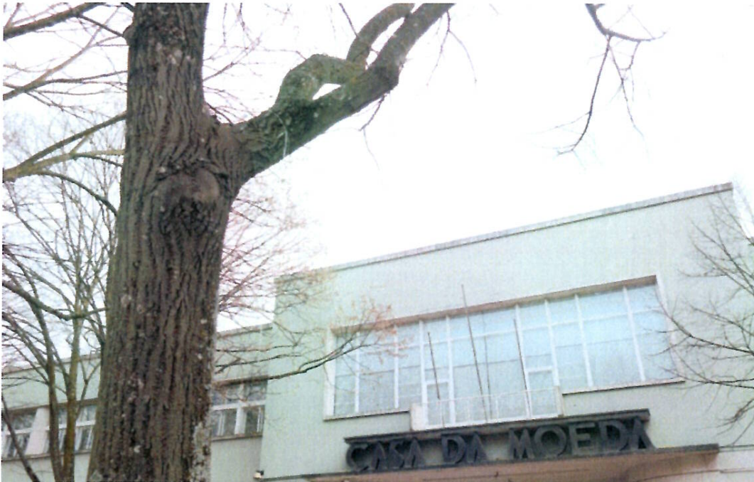
Casa da moeda