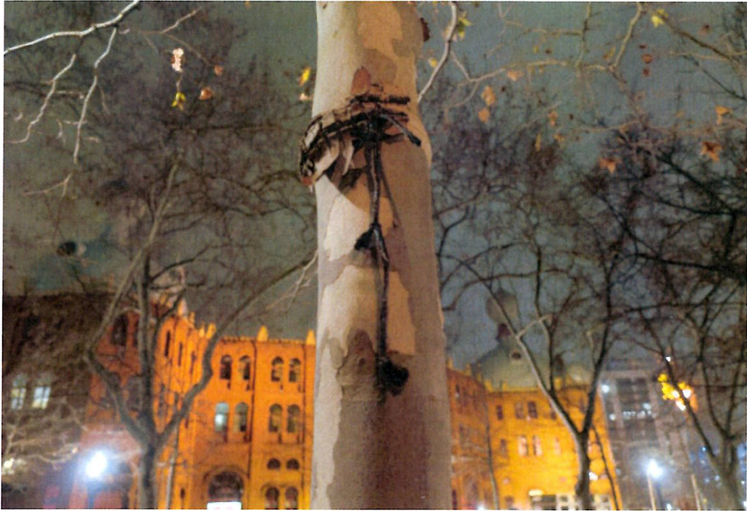
Campo pequeno (do lado de entrecampos)