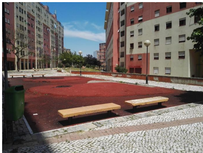
Vista parcial – espaço do antigo equipamento