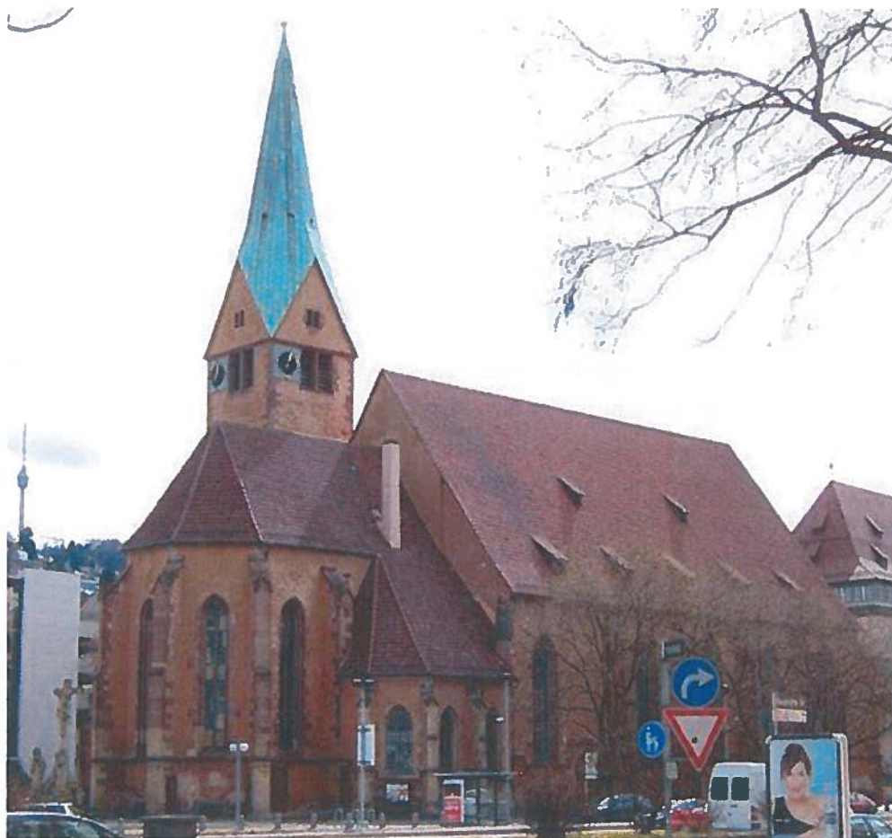
Igreja Leonardkirchen de Estugarda